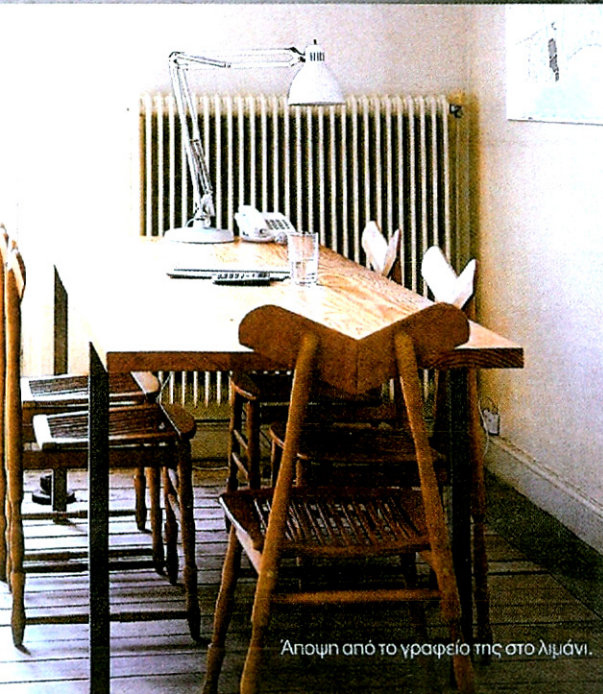
Άποψη από το γραφείο της στο λιμάνι.

υλικών είναι πάντα προκλητικά και δύσκολη σχεδιαστικά.