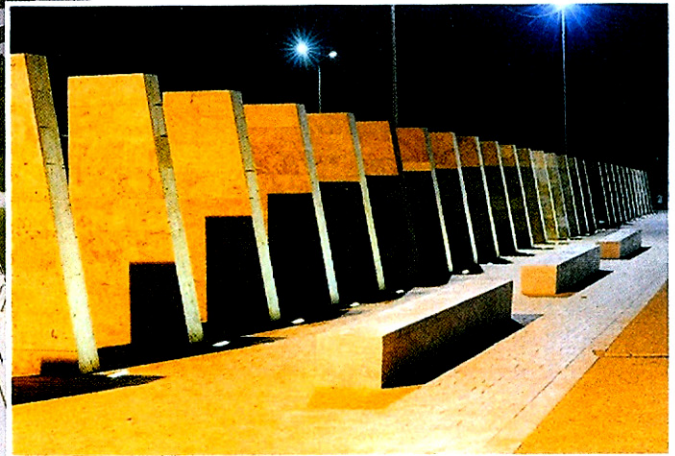
Διαμόρφωση του περιβάλλοντα χώρου του Λευκού Πύργου Θεσσαλονίκης.